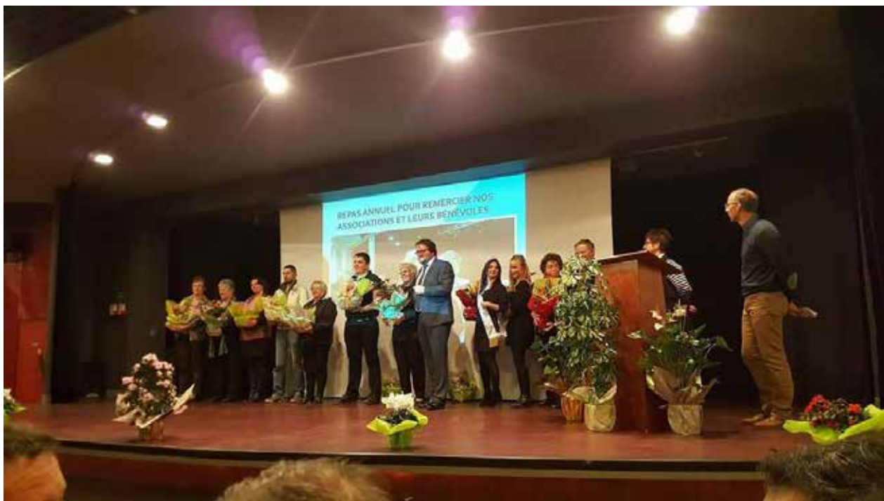
> Cérémonie des vœux : remises des cadeaux pour les concours des maisons fleuries ainsi que des illuminations de Noël