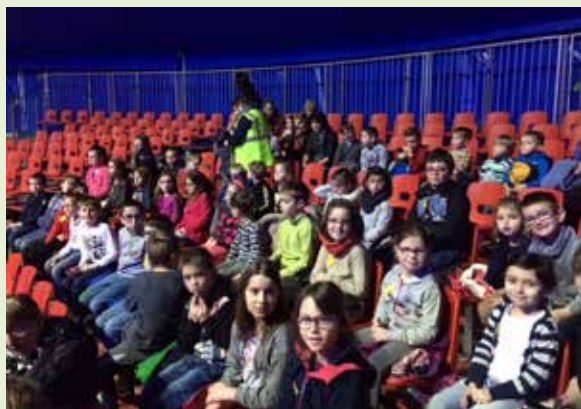
Les enfants au cirque Pinder

Accueil de Loisirs - 200 Rue Marcel Bisault (dans l'école)