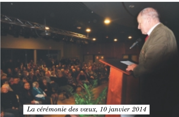
La cérémonie des vœux, 10 janvier 2014

Concernant les nouveaux rythmes scolaires, la commune a proposé que les 3 heures d'activités périscolaires soient placées de 13h30 à 14h30 les mardi, jeudi et vendredi. Certaines activités sont déjà définies, d'autres devront être développées d'ici septembre 2014. En tout cas la commune agira au mieux de l'intérêt des enfants. Nous attendons la réponse de l'Education nationale.