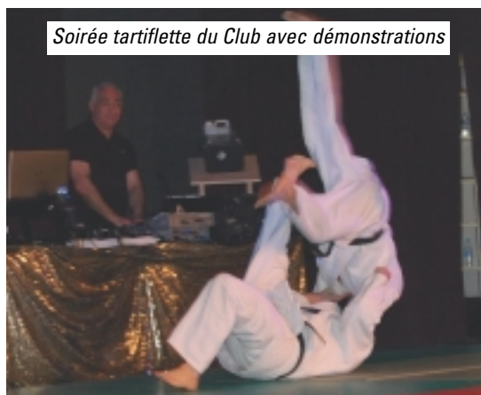
Soirée tartiflette du Club avec démonstrations

Le Judo club de St-Georges Val de Cher vous propose de nombreuses activités sur 3 sites (St-Georges, Montrichard et Thésée) : Eveil Judo (4 et 5 ans), Judo, Jujitsu, Taïso, Self défense féminine ... On pourrait vous en parler, mais le mieux c'est de venir essayer ... alors à très bientôt sur le tatami, dans la convivialité ! N'hésitez pas à venir faire une séance d'essai.