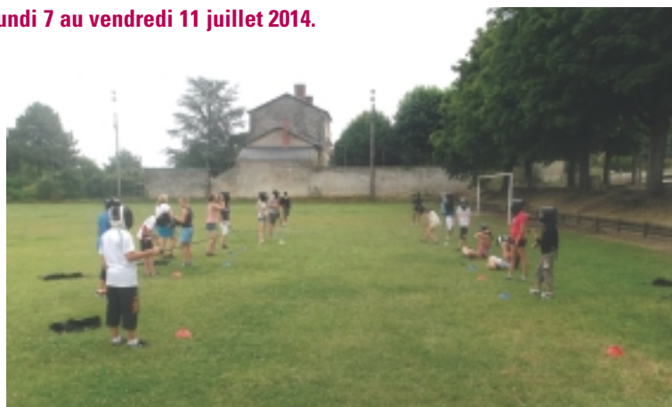
Pratique de l'escrime lors du stage USEP 2013

Nombre de places limité à 24 participant(e)s.