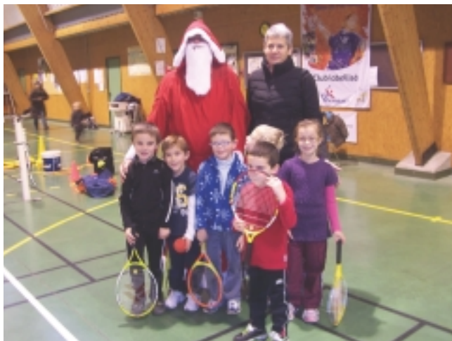
Le Père Noël s'est invité au cours de mini-tennis