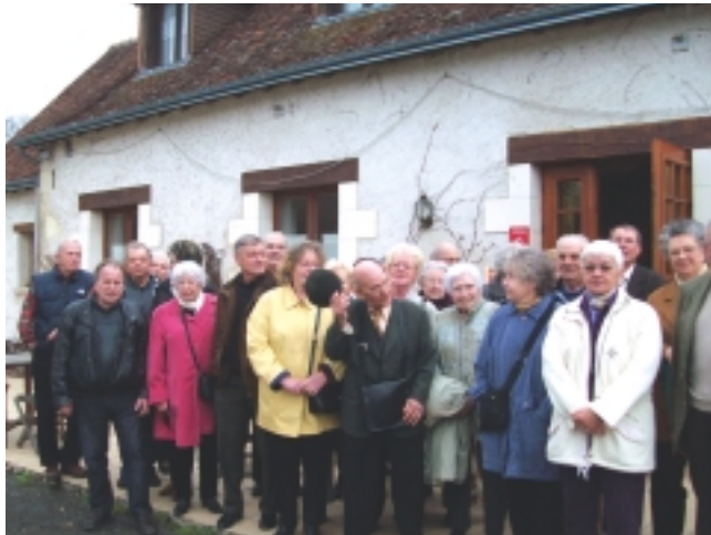
L'Age d'Or en sortie