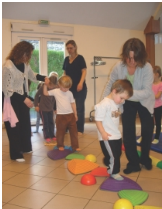
Activité gymnique pour les plus jeunes

Bravo à nos petits Usépiens... Merci aux accompagnateurs... Merci aussi à la mairie pour la mise à disposition du car communal qui nous permet de nous rendre sur les lieux de quelques rencontres.