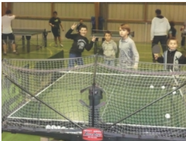
Entraînement au robot

Contacts : Jean-Michel Janssens ☎ 06 71 10 01 71 ou Gilles Pellé ☎ 06 75 53 34 80