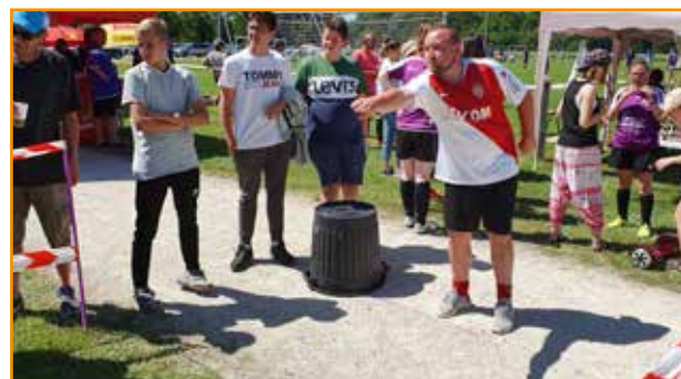
> Tournoi du 22 juin

installations sportives, et s'est réjoui de la belle fin de saison des 230 licenciés de l'USSG.