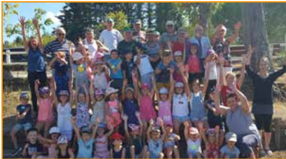
> Initiation pétanque

Comme les années précédentes, nous avons également accueilli les enfants du Centre Aéré pour une initiation à la pétanque. Un bon moment de détente entre les enfants et les séniors.