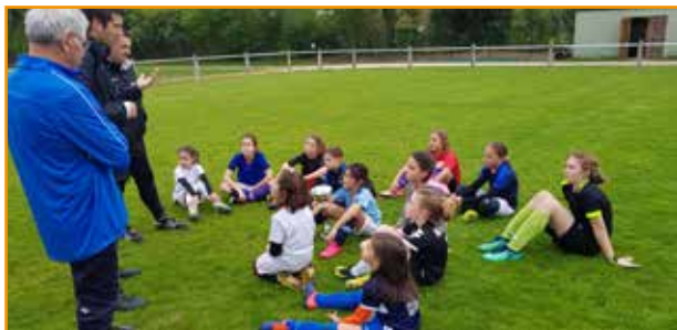
> Réunion du District, des dirigeants et des Jeunes