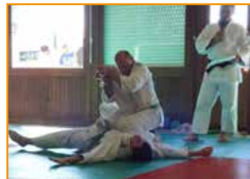
> Démonstration Jujitsu

Taïso : mercredi 20h30-22h00 vendredi 19h15-20h15