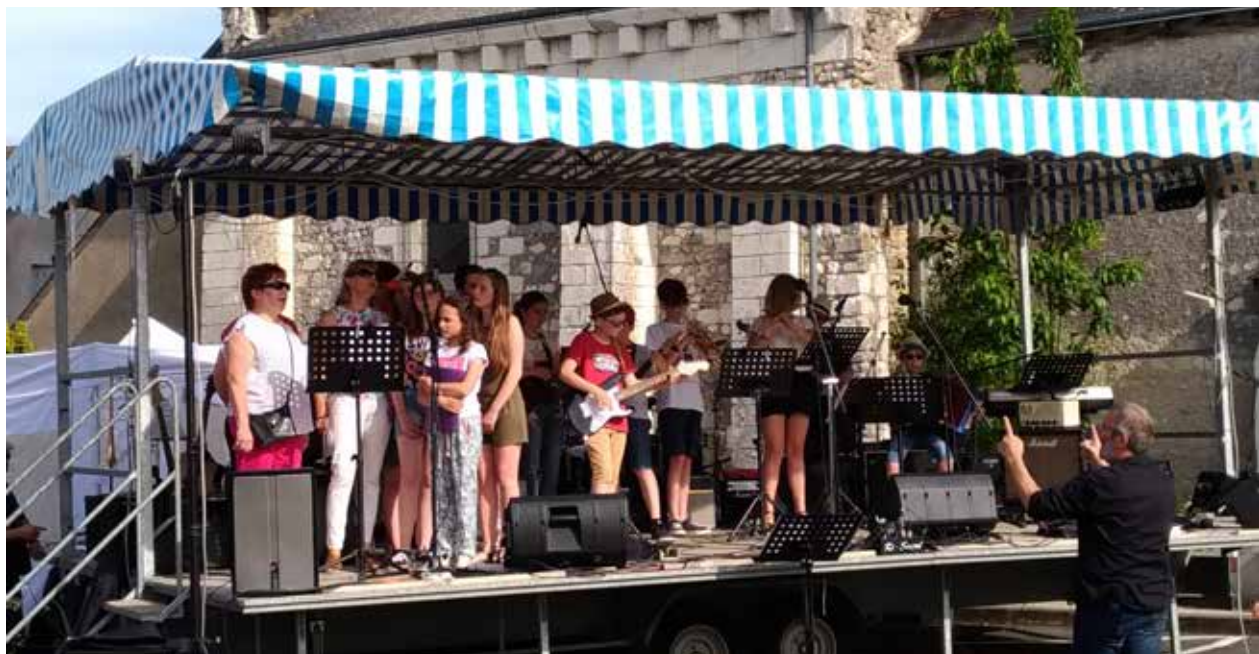
> Fête de la Musique