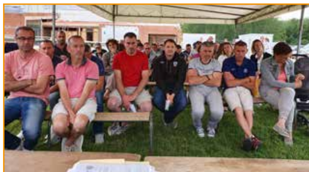
> AG de l'USSG 21 juin