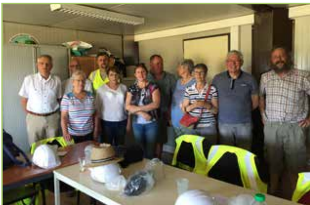
> Visite du centre de tri

Pour y participer, il suffit d'appeler le 02 54 75 76 63 ou d'envoyer un mail à communication.smieeom@orange.fr