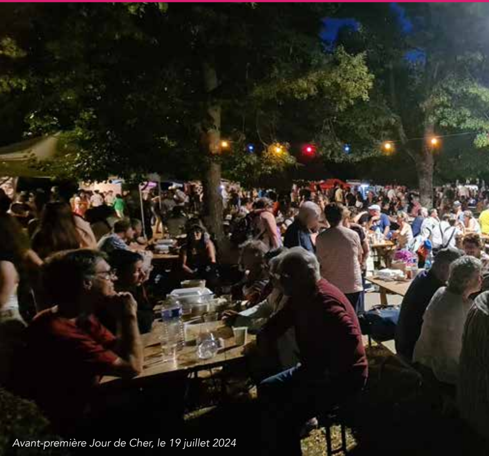
Avant-première Jour de Cher, le 19 juillet 2024