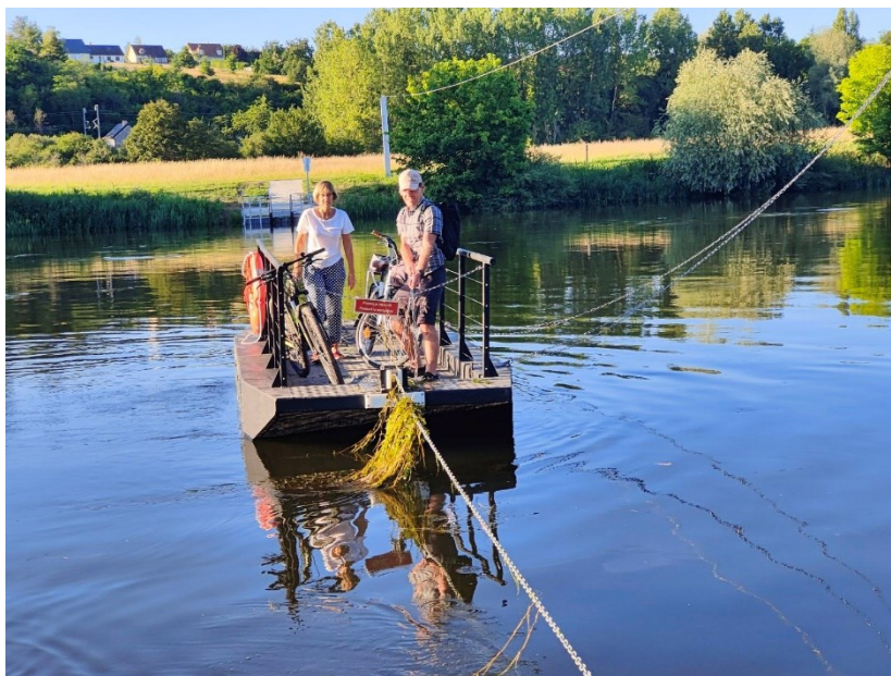
Bac à chaînes reliant les deux rives du Cher à quelques dizaines de mètres du site